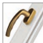
MANIGLIA ATLANTA oro satinato F3