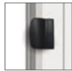
WIN CLICK nero