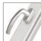
MANIGLIA ATLANTA cromo satinato F1