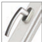
MANIGLIA ROTO LINE platiniun