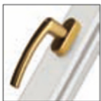
MANIGLIA ROTO LINE ottone satinato F3