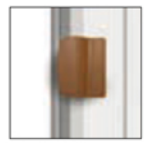
WIN CLICK caramello