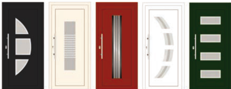
KALCYT 01 MIENNESOTA 06 TURKUS 10 CHALCEDON 01 AMETYST 02