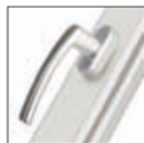
MANIGLIA ROTO LINE cromo satinato F1