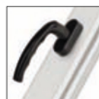
MANIGLIA ATLANTA marrone