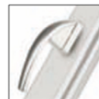
MANIGLIA SWING cromo satinato F1