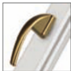
MANIGLIA SWING ottone satinato F3