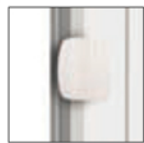
WIN CLICK bianco