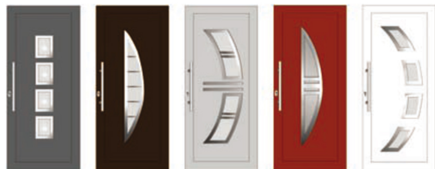
ANNAPOLIS 01 ATLANTA 01 KASJOPEJA 01 SANTE FE 2 PORTLAND