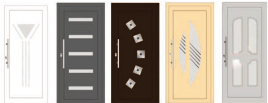
HEMATYT 02 AZYRYT 01 LAZURYT 01 AWENTURYRN 03 GRANAT 01