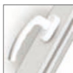
MANIGLIA ATLANTA bianco