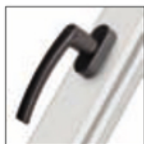
MANIGLIA ROTO LINE marrone chiaro