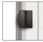
WIN CLICK marrone