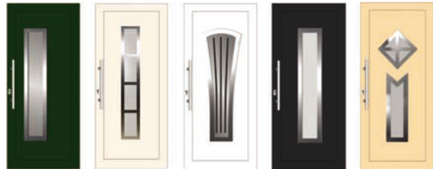
CHICAGO 01 SACRAMENTO 2 TURKUS 10 FLORIDA III - 01 NASHVILLE