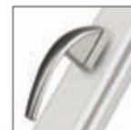
MANIGLIA SWING titanio F9