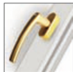
MANIGLIA ROTO LINE ottone lucido F3