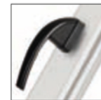
MANIGLIA SWING marrone