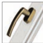
MANIGLIA ROTO LINE oro antico F4