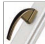
MANIGLIA SWING oro antico