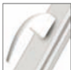
MANIGLIA SWING bianco