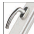
MANIGLIA ATLANTA titanio F9