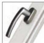
MANIGLIA ROTO LINE titanio F9